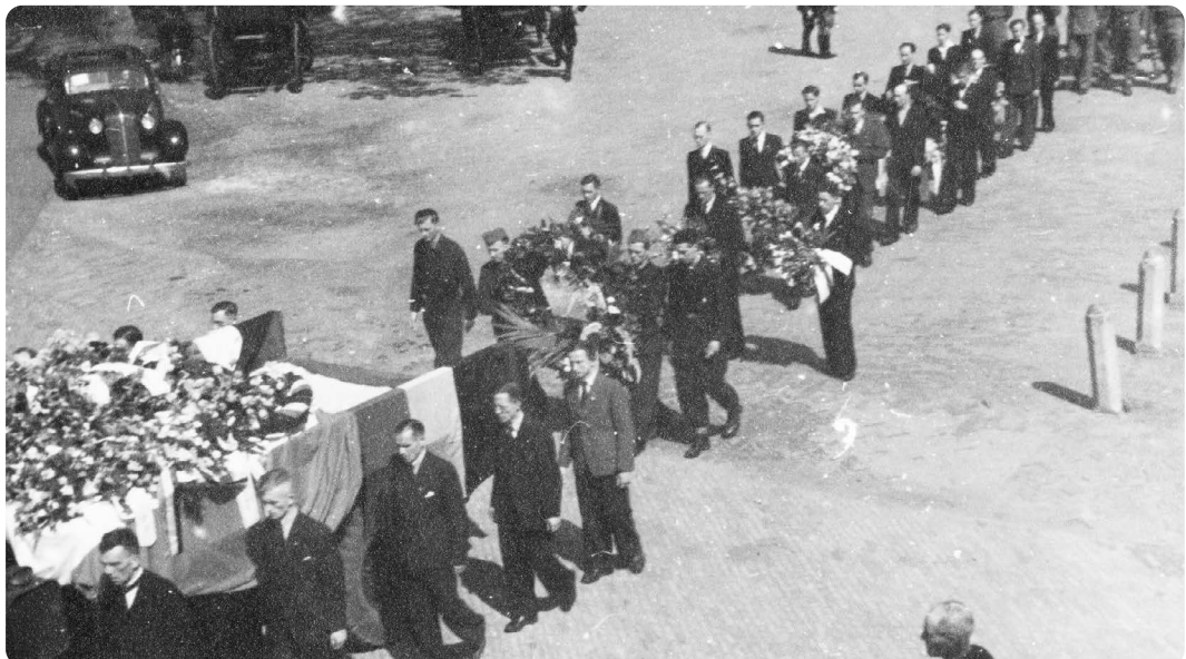
Begrafnisstoet van BS'ers die omkwamen bij het Rosarium.

Enkele uren later trokken de Geallieerde Polar Bears via de Biltstraat, slechts een paar honderd meter verderop, de stad binnen.