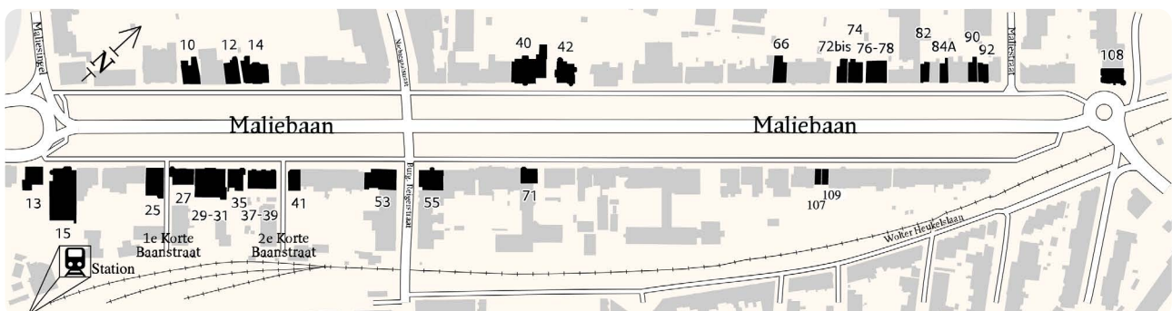
Bron: Aan de Maliebaan – Ad van Liempt

In het boek van Ad van Liempt "Aan de Maliebaan" en de website www.aandemaliebaan.nl staat zeer uitgebreide informatie over de Maliebaan tijdens WOII. Hieronder is een korte selectie weergegeven.