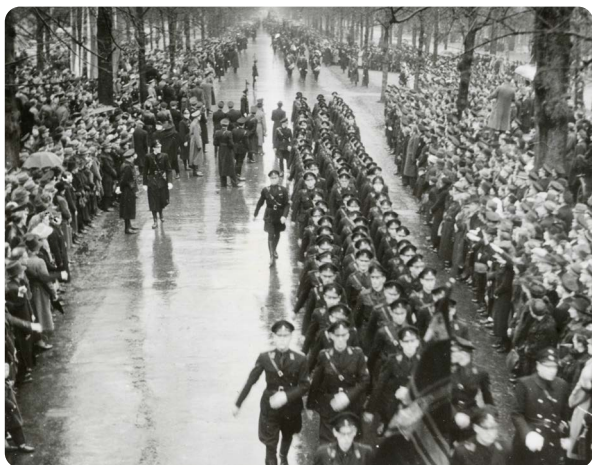
Parade op de Maliebaan.

Regelmatig vonden er grote parades plaats op de Maliebaan, bijvoorbeeld bij jubilea van de NSB of de verjaardag van Mussert op 11 mei, waarbij hij op het balkon van nummer 35 de menigte toesprak. Een van de hoogtepunten voor Mussert was het bezoek van Heinrich Himmler, leider van de SS en een van de belangrijkste leiders van de NSDAP, aan het NSB-kantoor op 19 mei 1942. Op 7 mei 1946, één jaar na zijn arrestatie, is Mussert op de Waalsdorpervlakte geëxecuteerd. In 2021 worden zijn laatste woorden openbaar gemaakt.